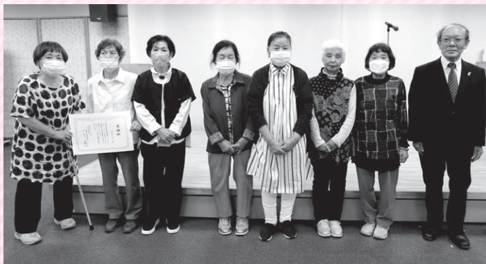
わくわくフェスティバル福祉団体表彰の様子