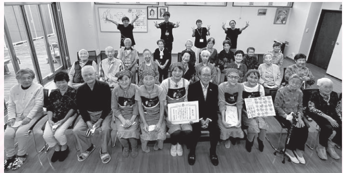
在ボラコスモスの会