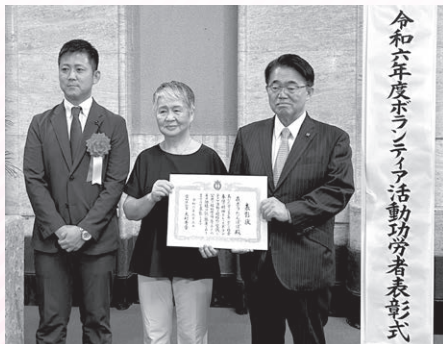
在ボラたんぼぼの会