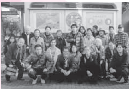
(上) 防災センター見学（研修会） (右) 防災（障がい対象）訓練