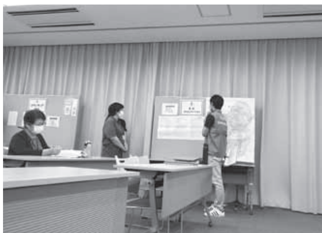
模擬演習の様子。今年度は密集を避けるために、社協の職員が代表で行いました。