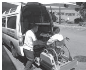
移送サービスの様子

サービスを利用する人も提供する人も同じ住民同士です。制度に捉われず、介護・家事・子育てなど、地域での当たり前の暮らしを支える地域福祉活動です。 (※会員登録が必要です。)