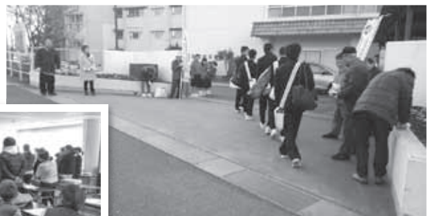
(上) 障害者週間キャンペーン 各団体及び支援団体の参加あり