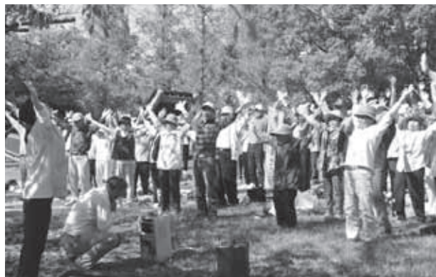
あるけあるけ大会