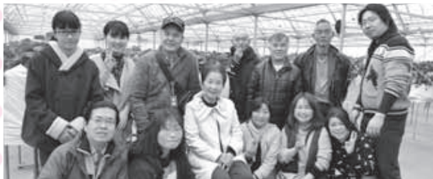
外出行事：いちご狩り

※ろう者とは、手話言語を主なコミュニケーション手段とする、聴覚に障がいをお持ちの方の事です。