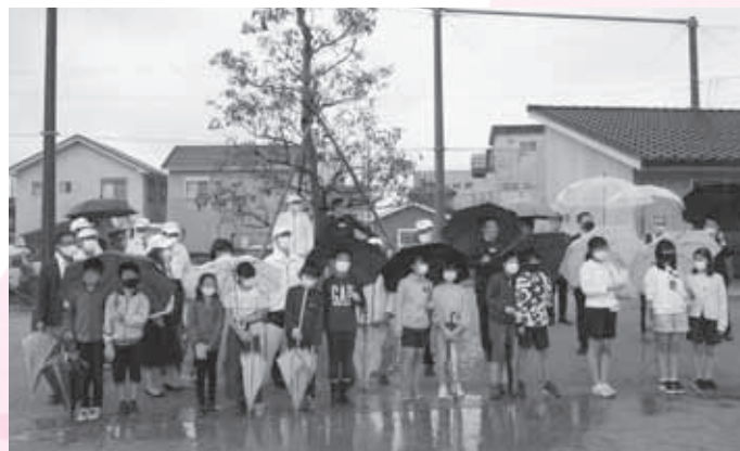
高浜ロータリークラブでは、新会員を随時募集しております。

問合せ：0566-55-6247 E-mail: tkhm-rc@katch.ne.jp