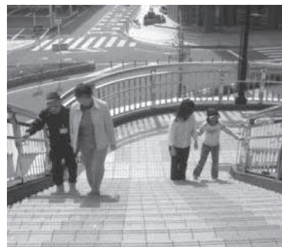
ガイドヘルプ体験を行う様子

2グループでは、活動を共にするメンバー募集中です！興味がある方は、ボランティアセンターまでお問合せ下さい。