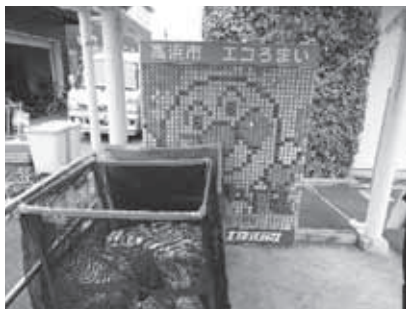
↑エコハウスにあるキャップ収集場

【活動日】 月2回火曜日 13:30～15:30：サウンドテーブルテニス 偶数月第1または第2日曜日 9:00～11:00 定例会、近況報告、困り事相談等