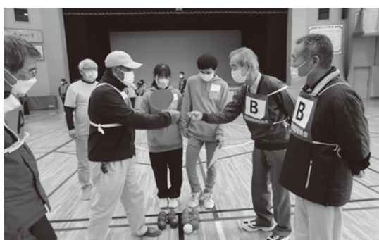
決勝戦は、初出場「チーム吉浜B」対前回王者「青木クラブチーム」