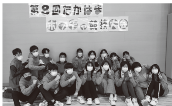
ボランティアとして審判、ボールの消毒をつとめていただいた高浜高校のみなさん。ご協力ありがとうございました。