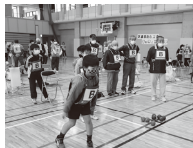
世代を超えた白熱した戦い

本大会は、障がい、年齢に関わらず、非常に幅広い層の方が参加し、交流できる大会となってきました。これからも、地域のつながりをつくる機会となれるように大会を開催していきたいと思ひます。次回もみなさんの参加をお待ちしております。