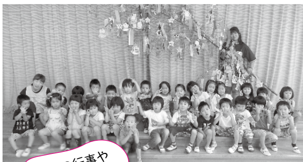
季節の行事や異年齢の交流