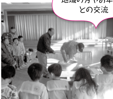
地域の方やお年寄りとの交流