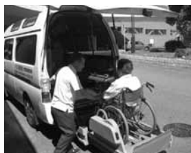
移送サービスの様子