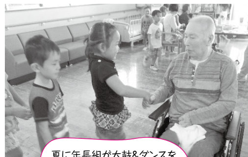
夏に年長組が大鼓&ダンスを披露しました♪