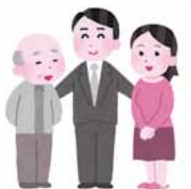
本人 公証人 支援者

・ 契約の際、公証人が同席します。公証人が契約内容を公正証書に残します。 ・ 支援者には、実の子、義理の子、親しい隣人、法人、弁護士等を選ぶことができます。